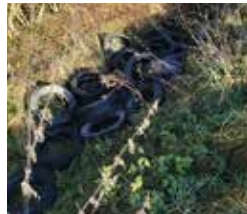
Bild links: Bauschutt im Weg/Schachtebich; Bild Mitte: Reifen in Oberstein; Bild rechts: 30 Reifen in Rustenfelde

Der Gewässerunterhaltungsverband Leine / Frieda / Rosoppe sucht zum nächstmöglichen Zeitpunkt, spätestens jedoch zum 01. Juni 2022 bzw. zum 01. September 2022 eine/n: