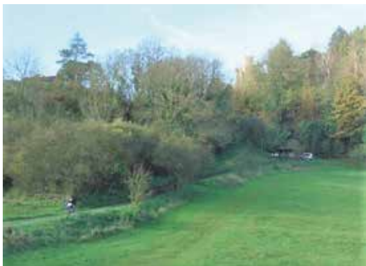
Zwischen Ortsausgang und Hansteinstraße soll ein Betonspurbahnweg zur Besucherlenkung entstehen

Mit dem Flurbereinigungsbeschluss entsteht die teilnehmergeinschaft bestehend aus den Grundstückseigentümern im Verfahrensgebiet. Als erster schritt im Verfahren ist die Wahl des ehrenamtlichen Vorstandes Teilnehmergeinschaft geplant. Hierfür werden interessierte Bürger gesucht, die das Flurbereinigungsgebiet Bornhagen aktiv neugestalten wollen.