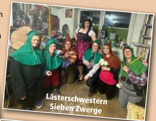
Lästerschwester Sieben Zwerge