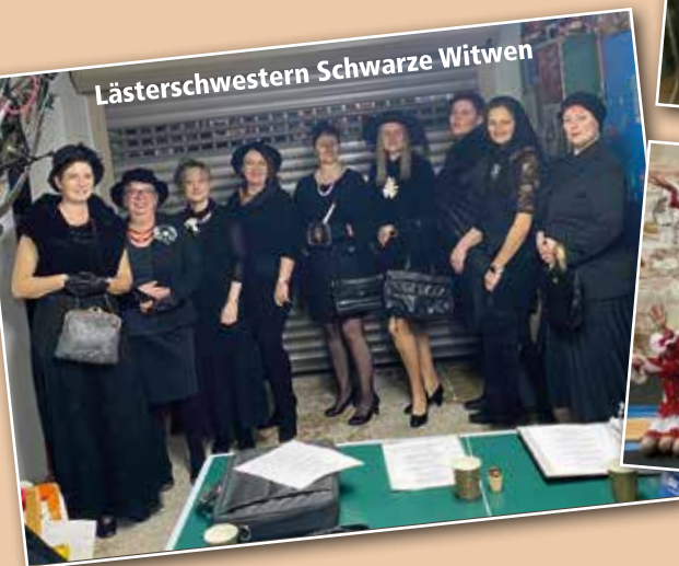
Lästerschwester Schwarze Witwen