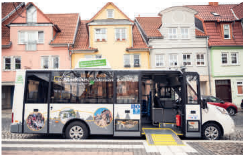
Elektrisierend mobil: Mit diesem StadtBus-Unikat sind Fahrgäste in der Kurstadt CO 2 -frei unterwegs.

„Ich freue mich auf die jüngsten Fahrzeuge der Thüringer E-Bus-Flotte. Landesweit setzen Busunternehmen im Nahverkehr inzwischen auf Elektrobusse und bringen damit Klimaschutz auf die Straße.